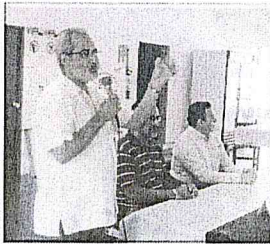
Inauguración por parte del Director del CEPAVI, Coordinador del Campamento y Director del DIF Mazatlán.

Se realizó del 24 al 29 de Agosto en el Campamento del Heroico Puerto de Mazatlán de DIF Nacional, se dividió en dos grupos conformados por personal operativo de las UAVI, CEF, Dirección de Atención al Maltrato, SSJ, Prevención del Delito en Tonalá.